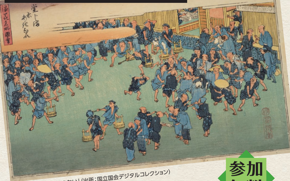
歌川広重「堂じま米あきない」